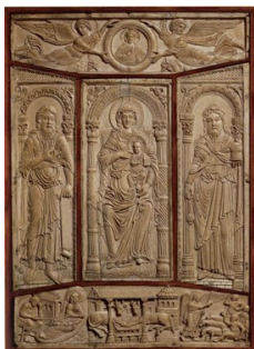
L'Évangélaire de Lorsch, bibliothèque apostolique vaticane, 778-820.