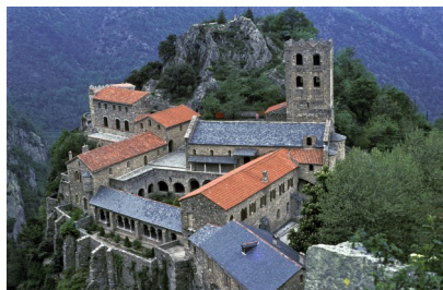
Saint Martin du Canigou, monastère fondé au Xe siècle par Guilfred II comte de Cerdagne