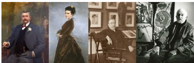
De gauche à droite : Ernest Cognacq - Nélie Jacquemart - Isaac de Camondo - Jacques Doucet